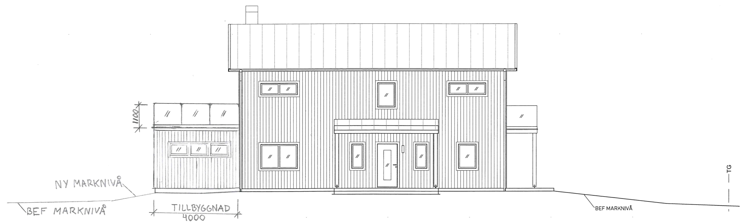
FASAD MOT NORR 1:100

FÖRKLARINGAR BEF BEFINTLIG TG TOMTGRÄNS STÅENDE TRÄPANEL