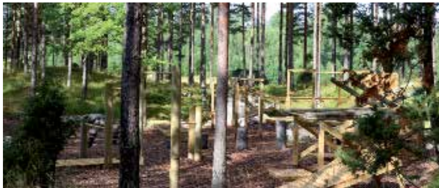
I ett naturgym kan man till exempel lyfta stockar, göra sit-ups eller göra övningar med sin egen kroppsvikt som motstånd. (Bilden visar ett gym som liknar det som ska byggas i Töllstorp.)