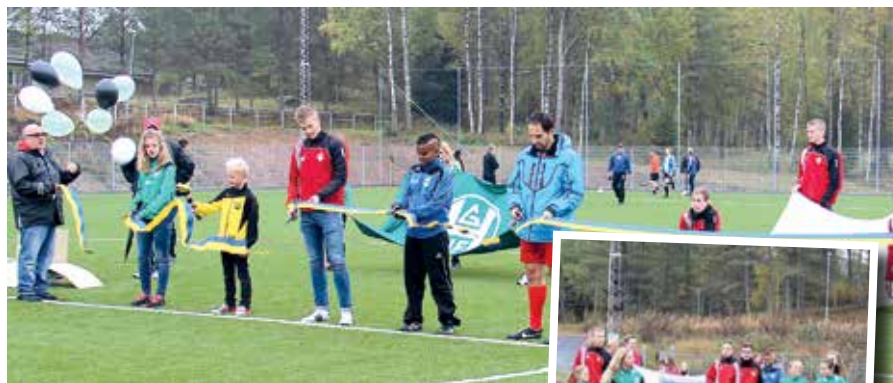
Representanter för de fem fotbollsklubbarna i kommunen tågade in med sina klubbflaggor. Därefter blev planen officiellt invigd genom traditionsenlig bandklippning.