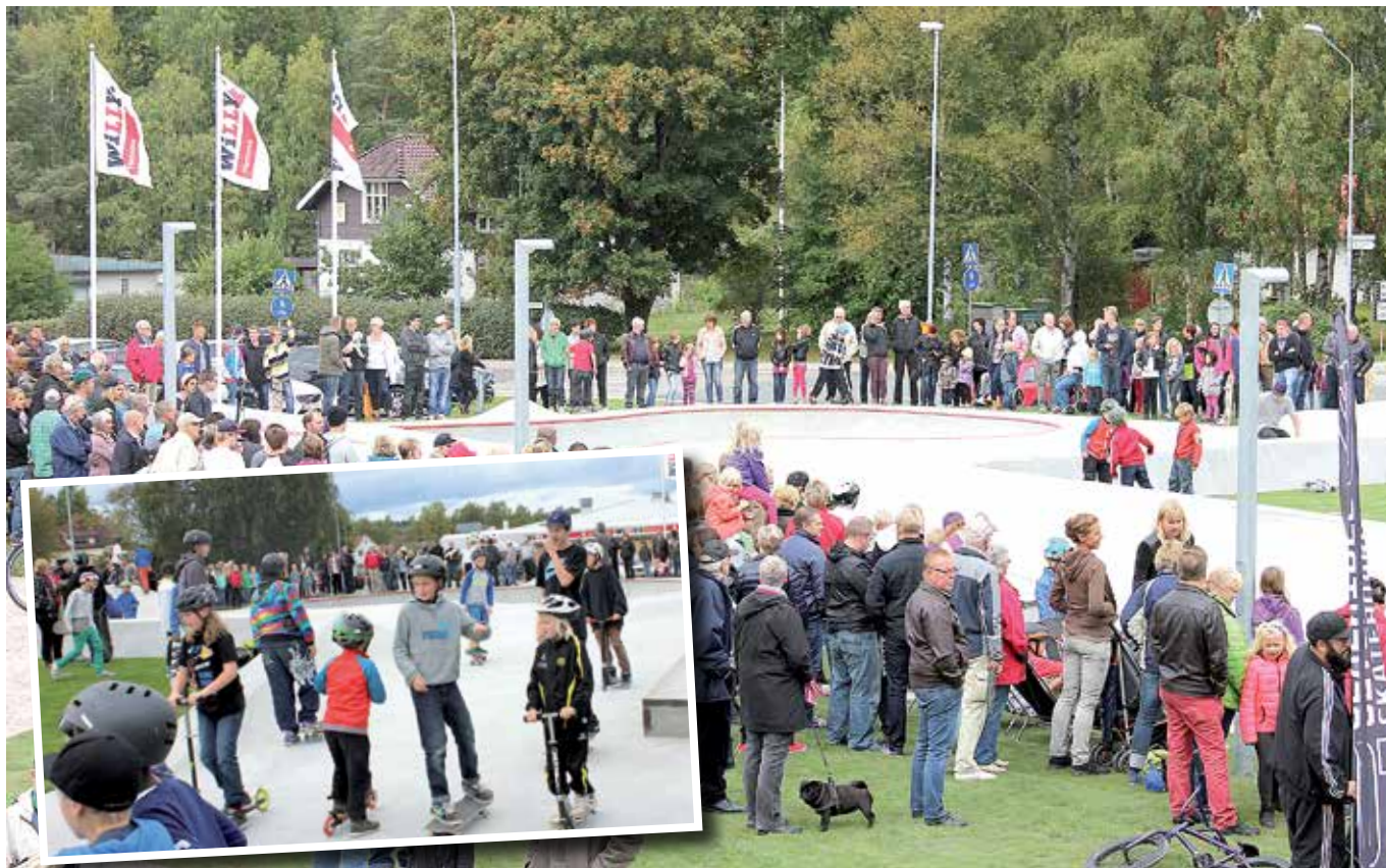
Vid invigningen den 21 september kom 700-800 personer till skateparken. Även om alla besökarna inte hade med sig en skateboard, så blev ändå ganska trångt.

Nyhetsbrevet till dig som flyttat från Gnosjö kommun