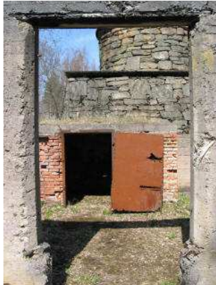
Häryds bruk, masugnsruinen från gjuteriet, foto: Magnus Gustavsson.