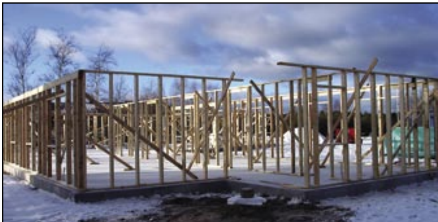
På Töllstorpsområdet i Gnosjö pågår byggnationen av kommunens nya vandrarhem. Lagom till O-ringen i sommar ska byggnaden stå klar.

Vandrarhemmet kommer ha 12 rum där varje rum har fyra bäddar och dessutom egen uteplats mot sydväst. Byggnaden är fullständigt handikappanpassad. I det gemensamma köket finns bland annat höj- och sänkbara bänkar. Fyra av rummen är anpassade för lång-